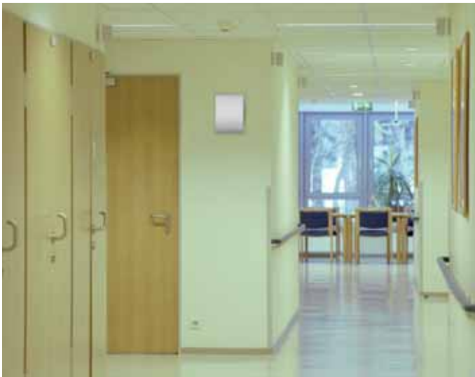
Unauffällige Patienten-Transponder werden von der Sende-/Empfangseinheit im Türbereich sicher ermittelt.

Ruhefrequenz (125 kHz) der Sende- und Empfangseinheiten geringste Körperbelastung und optimale Reichweiteinstellung ermöglicht, sichert die hohe Arbeitsfrequenz (868 MHz) die schnelle und zuverlässige Datenübertragung, wenn sich der Transponder im Sicherungsbereich befindet. Ein spezielles Verfahren in der Sende-/Empfangseinheit regelt das Erfassungsfeld in Sekundenbruchteilen nach, wenn z. B. größere Metallteile eingebracht werden, durch die bei herkömmlichen Verfahren Störungen des Magnetfeldes eine sichere Erkennung verhindern würden. Die Transponder unterscheiden sich nach Betreuer- und Betreuten-Transponder. Sie sind in verschiedenen Bauformen bzw. für unterschiedliche Tragearten sowie mit sicheren Verschlüssen versehen erhältlich. Dies gewährleistet eine hohe Akzeptanz. Die verwendete Technologie sorgt für einen sicheren Betrieb mit extrem langer Lebensdauer der überwachten Batterie.